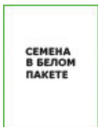
КАПУСТА ПОДАРОК б/к (1г. Российские семена)